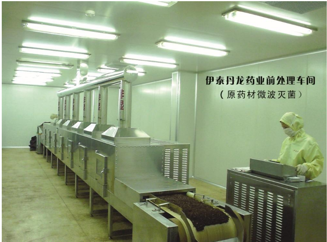
图 6 伊泰丹龙药业前处理车间

化学工业：2007 年末，全市规模以上化学工业企业 30 户，实现销售收入 6.34 亿元。主要产品产量：合成氨产量 2.33 万吨，硫酸产量 14.4 万吨，电石 4.35 万吨，化肥 19.3 万吨。