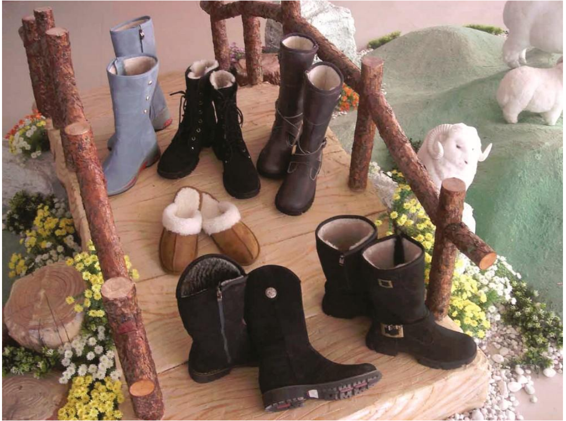
图 7 赤峰少数民族女士棉鞋