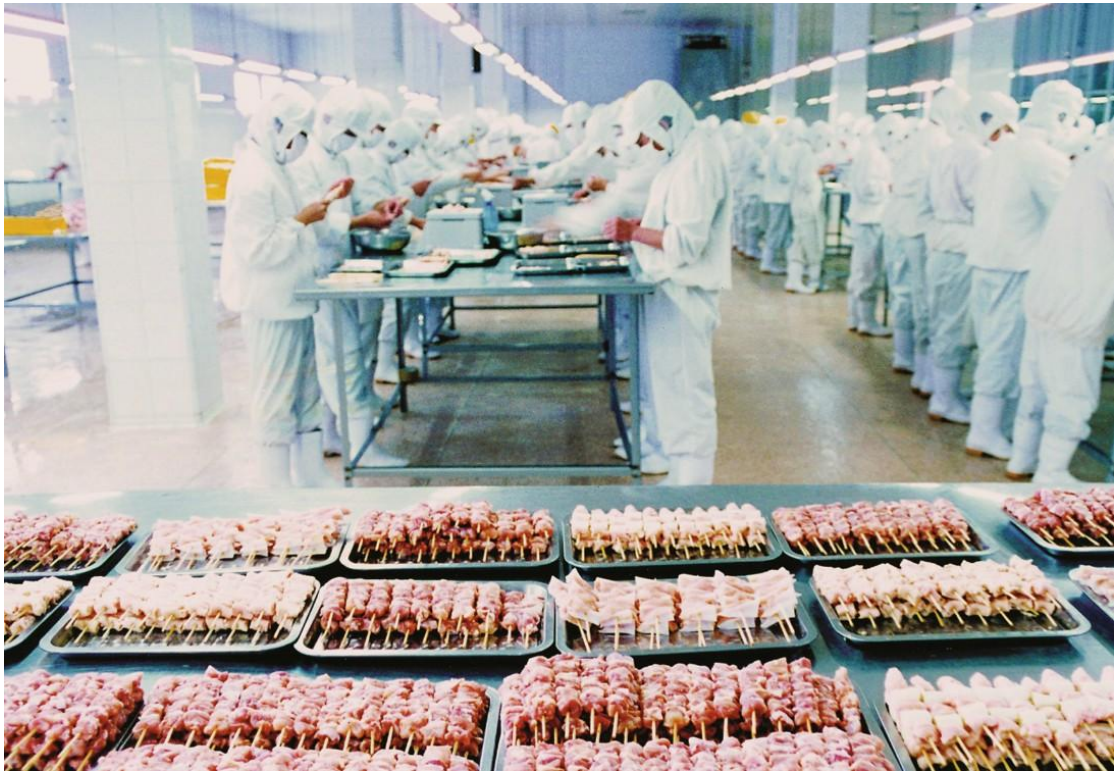
图 5 这家企业是内蒙古农畜产品加工行业的龙头企业。

医药工业：2007 年底，全市共有医药企业 34 家，实现销售收入 10.7 亿元；已经形成了涵盖化学药品、生物制药、医疗器械、卫生材料、中药工业、制药器械和兽用药品等各子行业的完整医药工业体系；拥有赤药集团、蒙欣药业、伊泰丹龙等在国家、自治区医药行业中的知名企业和雷蒙欣感冒药、赤峰牌麻黄素、灰黄霉素、土霉素以及丹龙中药等名牌产品。