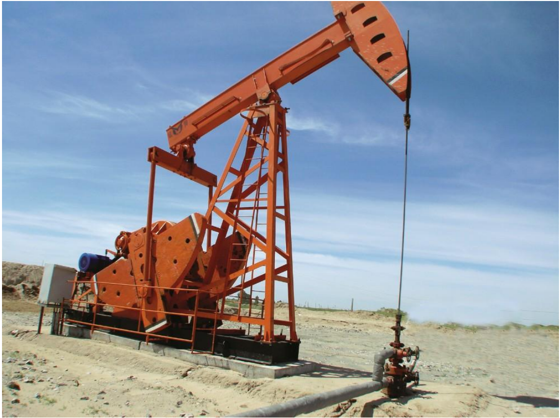
图 3 赤峰一家油田开发的现场。近年来赤峰市能源工业发展很快，为工业经济的发展奠定了坚实的基础。

冶金工业：2007 年末，全市各类金属采、选、冶企业达到 178 户，实现销售收入 271.06 亿元。全市矿山企业已形成日处理金矿石 3000 吨、日处理各类有色金属矿石 4 万吨和日处理铁矿石 5 万吨的采选能力以及年产 4000 公斤的黄金生产能力。全市矿山企业有色金属精矿粉产量达到 20 万吨（金属量），铁精粉产量达到 300 万吨。全市有有色金属冶炼和加工企业 12 户，有色金属冶炼产品产量 40.5 万吨；黑色金属冶炼企业 3 户，黑色金属冶炼产品产量 218 万吨。