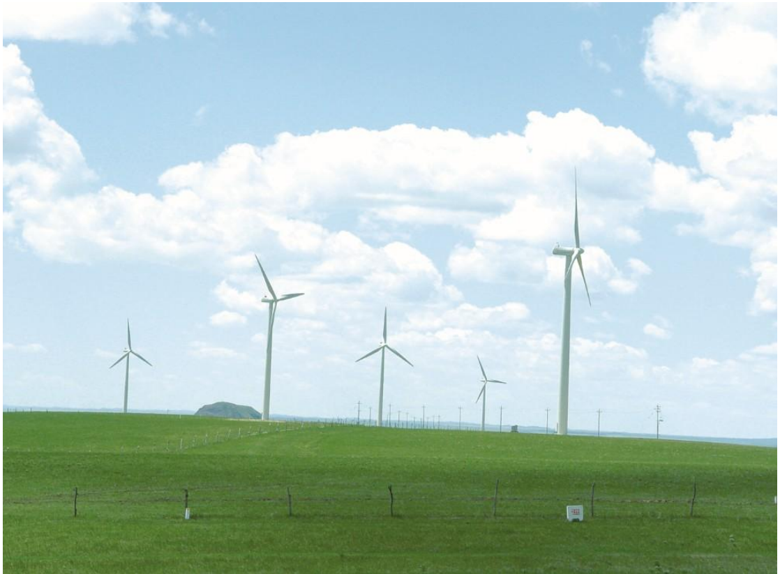
图 1 近五年来风电行业在赤峰市飞速发展

赤峰市自然及人文景观独特，丰富多彩。境内草原、森林、山峰、沙漠、温泉、湖泊、石林、冰臼等天然景观齐全，文物古迹、珍稀动植物众多，旅游资源集历史文化、自然风光、民族风情于一体，素有“自治区名片”和“内蒙古缩影”之称，被一些媒体形象地概括为：中华龙的故乡、大辽帝国的故都、世界地质奇观、北京的后花园。