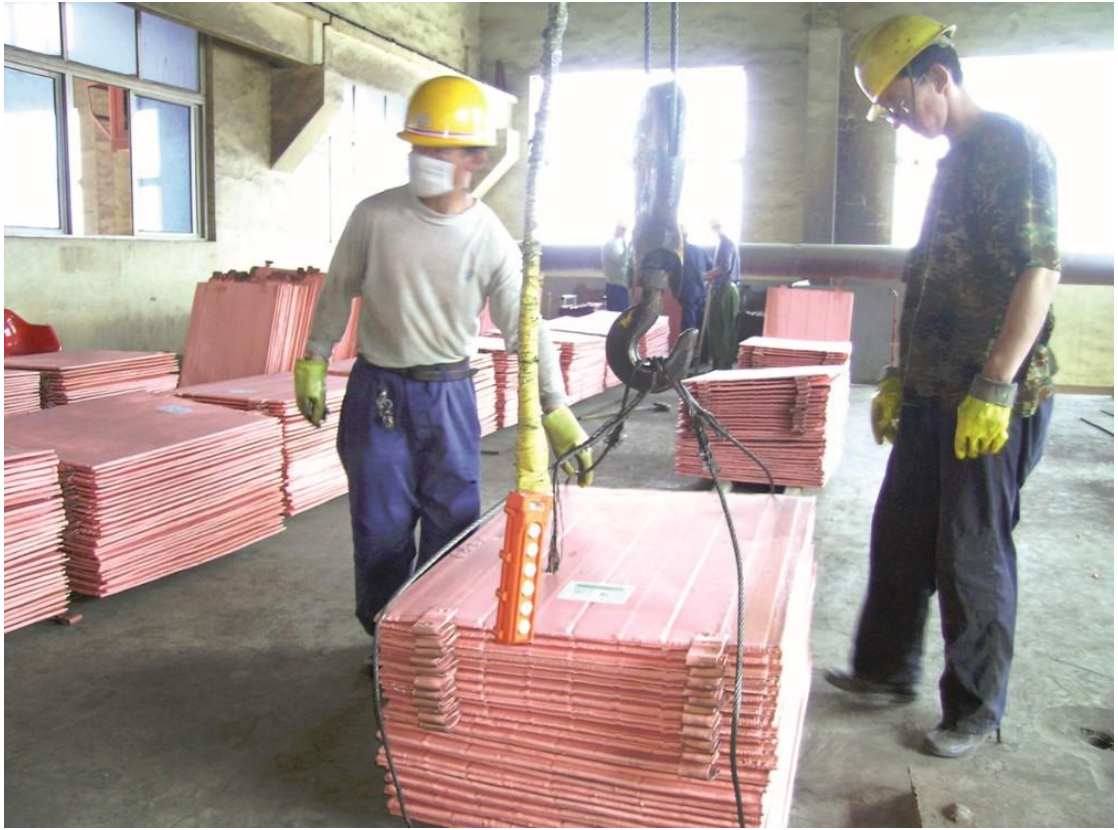
图 4 赤峰市精炼铜公司的车间

食品工业：2007 年末，我市共有规模以上食品企业 53 户，实现销售收入 45 亿元。已形成屠宰及肉类加工、粮油、酿酒、饮料等多个优势行业和十五个产品大类；拥有塞飞亚、燕京啤酒、安琪酵母、宁城老窖等一批国家、自治区食品行业知名企业和名牌产品。